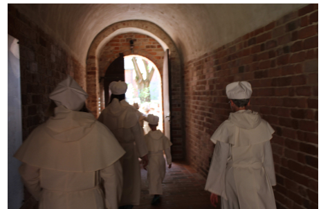
Kinder- und Familienführung